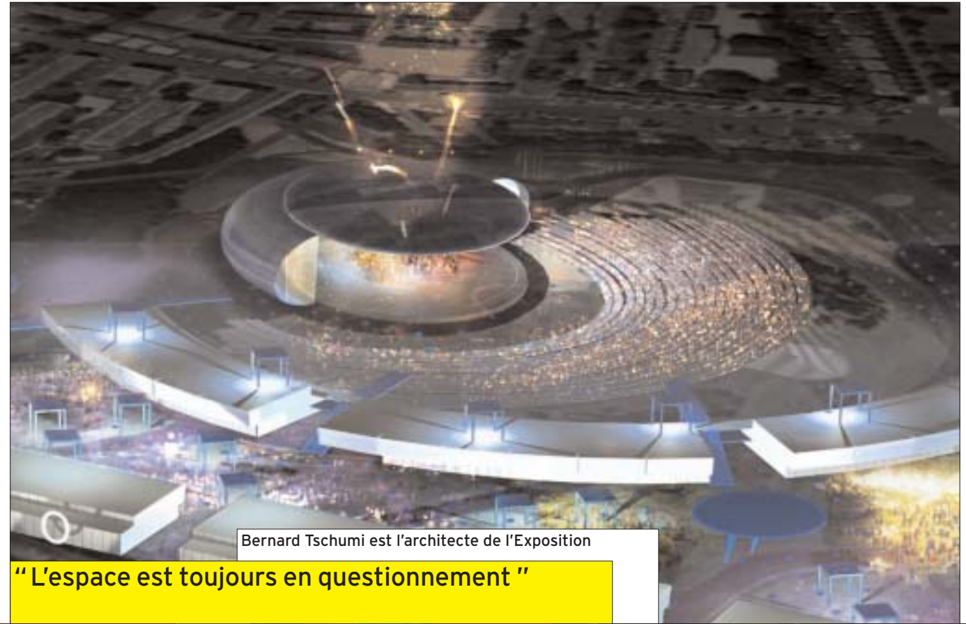
Bernard Tschumi est l'architecte de l'Exposition